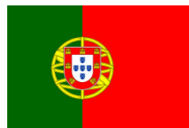
Флагът на Португалия с армиларна сфера