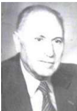
Проф. Стоян Петров

Поради липса на оборудване и дублиране с Държавната политехника в София, през 1948 г. е взето решение да се закрие Висшето техническо училище в Русе и студентите са изместени да продължат образованието си в Държавната политехника в София. След закриването на Висшето техническо училище Руска Драгнева посвещава на обучението и възпитанието на младото поколение Русе повече от 50 години от своя живот. Създава първата в страната специализирана школа по физика за изявени ученици (1970). Няколко десетки нейни възпитаници – тридесет и пет – се класират на подборните кръгове на Републиканската олимпиада по физика, а седемнадесет от тях вземат участие в международни олимпиади в Лондон, Москва, Хелзинки и др.