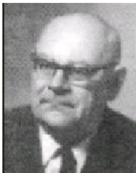
Проф. Разум Андрейчин